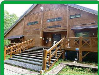
尾瀬山の鼻 ビジターセンター